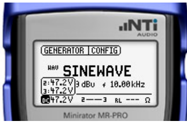
Minirator MR-PRO 幻象电源量测屏幕