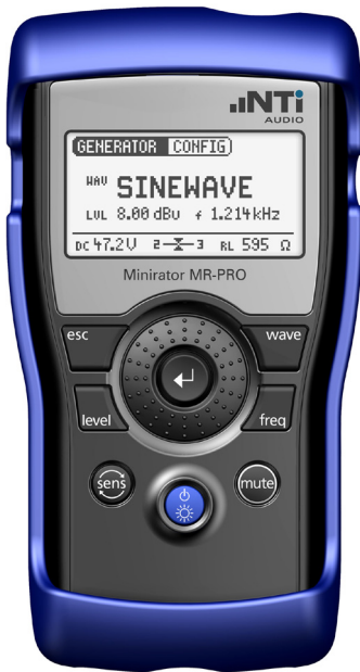
使用 MR-PRO 量测幻象电源

幻象电源在专业音响领域几乎是无处不在的。MR-PRO 内含有测试幻象电源电压的功能，可以持续监测和显示幻象电源输出端的直流电压。MR-PRO 也可以接到调音台的麦克风输入端，并持续监测满载或空载时的实际有效幻象电源电压。本应用指南详细描述了如何按照 IEC 1938 标准对幻象电源进行量测。