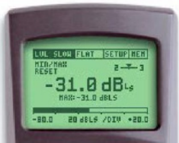
ML1 设定: LVL SLOW & FLAT