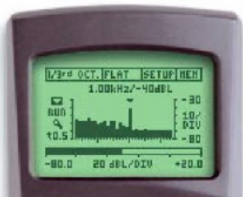
ML1 设定: 1/3 OCT & 1 kHz