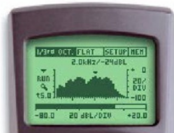
ML1 设定: 1/3 OCT & FLAT