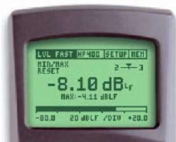
ML1 设定: LVL FAST & HP400