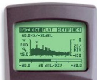
ML1 设定: 1/3 OCT & 5 sec