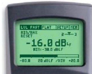
ML1 设定: LVL FAST & FLAT