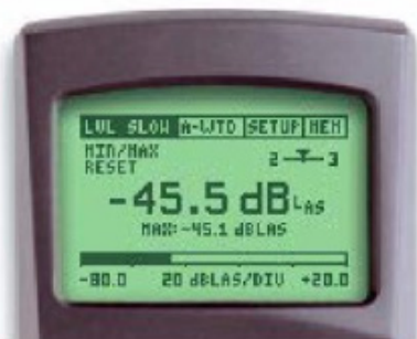
ML1 设定: LVL Slow & A-WTD