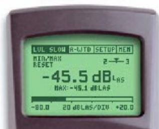
ML1 设定: LVL Slow & A-WTD