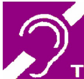
音频感应环路系统的标志