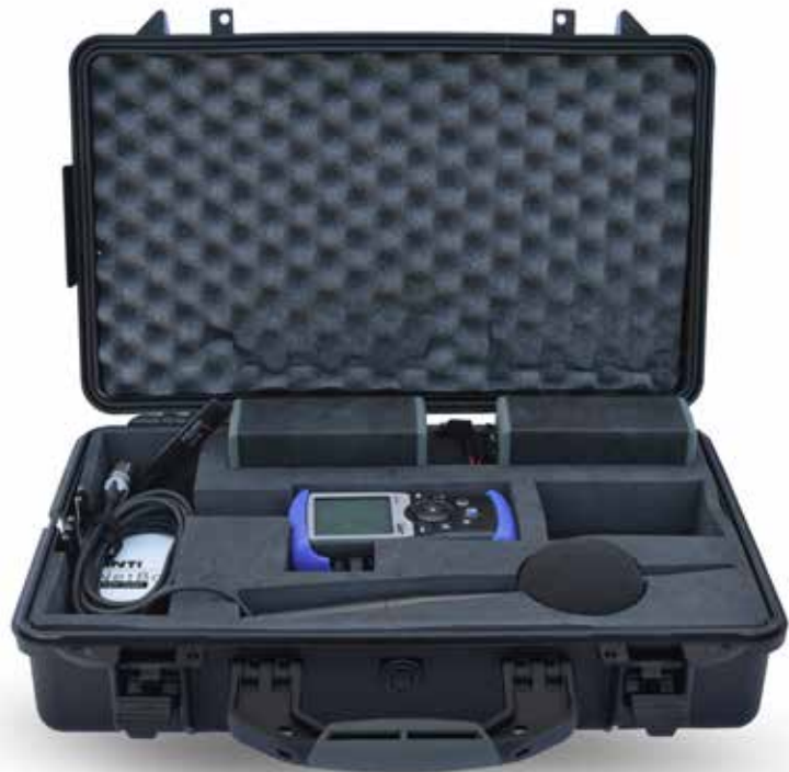
高性能户外保护箱 (不含设备)