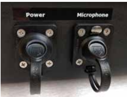
防水接口用于麦克风和外部电源供应 (IP65 级别)