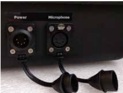
取下保护套的接口 (IP65 级别)

IP43 级保护箱一侧的缆线防溅盖可以让您进行灵活的缆线连接。IP65 级保护箱则提供两个防水 XLR 接口,和一根带公母转接的 5 米长 ASD 缆线。