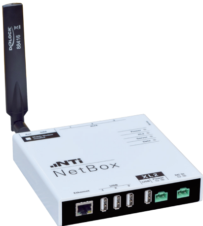
支持移动数据的 NetBox 和 XL2 声级计 用于无人值守噪声监测

NetBox 会从 XL2 声级计中获取经认证的一级噪声测量数据并将其传输至网络。数据将实时传输到 NoiseScout 网页版客户端实现全天候安全的噪声监测, 超限将有电子邮件报警, 在浏览器中即可下载数据和报告。